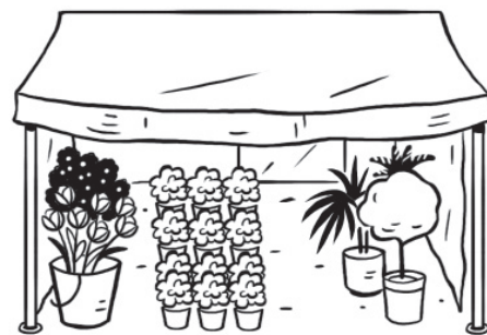
le magasin de fleurs